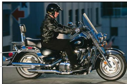
Suzuki Intruder 1500